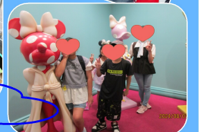
軽井沢おもちゃ王国