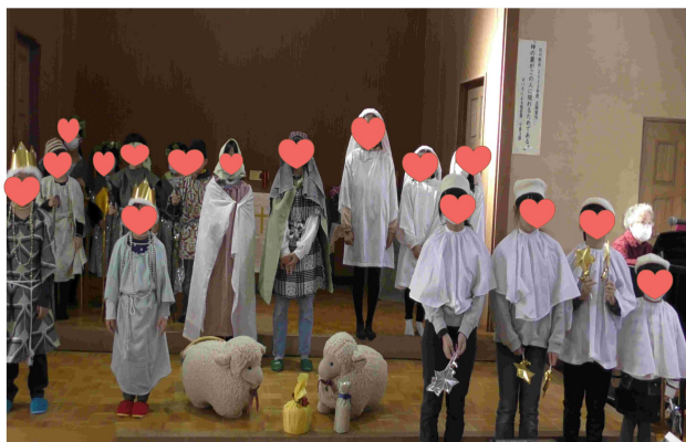
2023年のクリスマス・ページェント（渋川教会）

くれた有形無形の財産を大切にしている子持山学園の皆様の取り組みをお手本にして、三愛荘も進んでいければと存じます。子持山学園のますますのご発展を三愛荘一同心よりご祈念申し上げます。