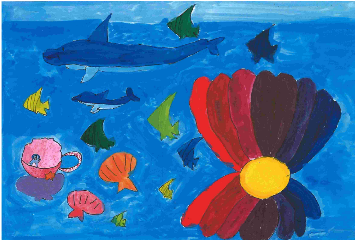
小3 女子 『海のパーティー』 全国児童養護施設協議会「児童文化奨励絵画展」入選作品